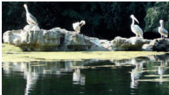
Organisatie als weerspiegeling van de natuur

De zienswijzen van Albert Einstein en Abraham Maslow worden gebruikt om praktische strategieën te tonen hoe het proces van verbeelding tot een vormingsproces kan komen, als antwoord op het Idee. Prikkelingen en ervaringen van de auteur leveren waardevolle gedachtespinsels voor ieder die zich bezighoudt met persoonlijke ontwikkeling en leiderschap in organisaties!